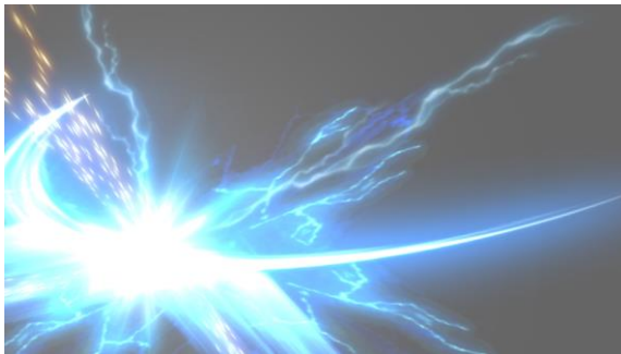
オリジンフォース！